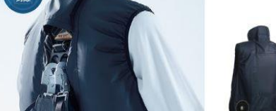
LX-6700WHVS(シルバー) LX-6700WHVN(ネイビー)