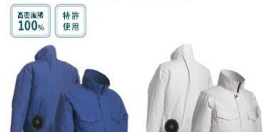
LX-6700WB(Bルー) LX-6700WS(シルバーグレー)