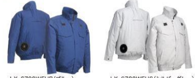
LX-6700WFH(Bルー) LX-6700WFHS(シルバーグレー)